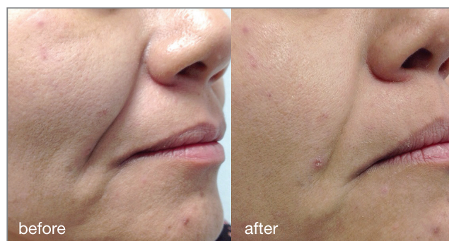
Fotona4D® procedure: courtesy of Adrian Gaspar, MD

En helt kall laserablation avslutar Fotona4D® protokollet och ger huden en vacker lyster.