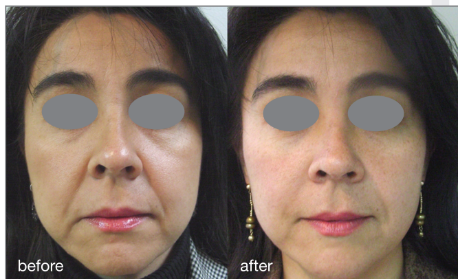
Fotona4D® procedure: courtesy of Adrian Gaspar, MD

"Together, these unique four laser modalities provide a full thickness penetration laser treatment that can really impress. You can treat superficially as well as down to the dermis, provide volumetric bulk heating, and then plump from the inside at just the right location for a synergistic effect. You get great results in one session, although as with other therapies, additional sessions provide additional improvement."